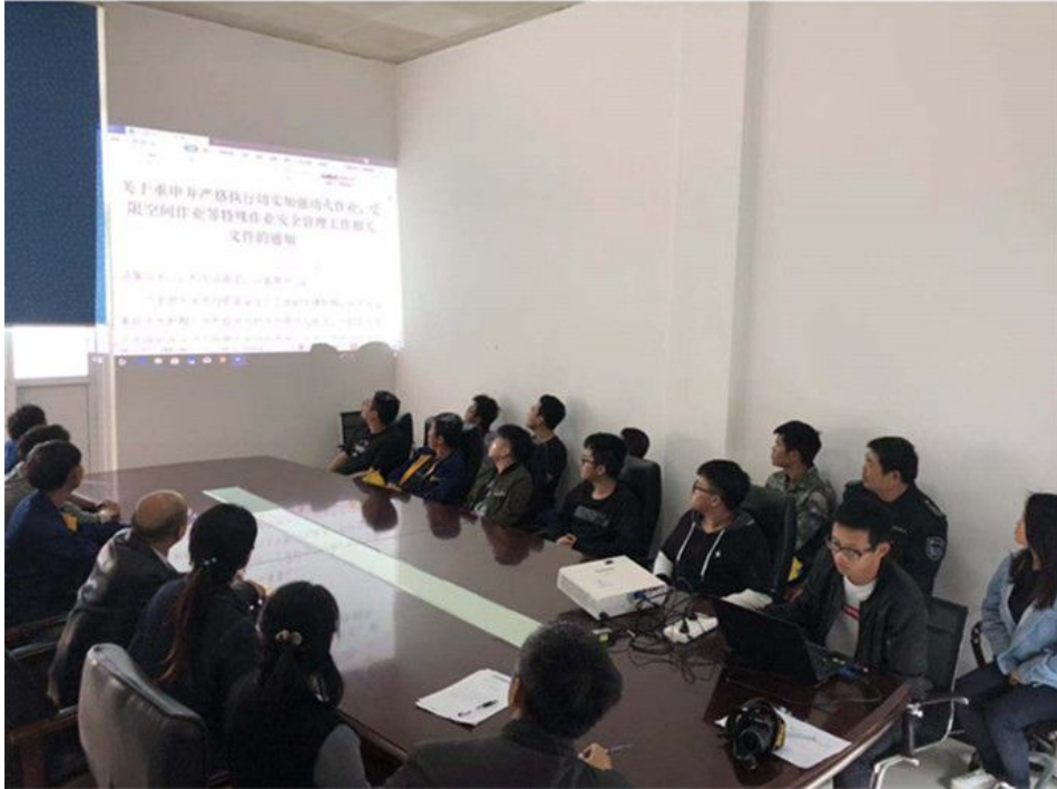
图 2. 员工培训