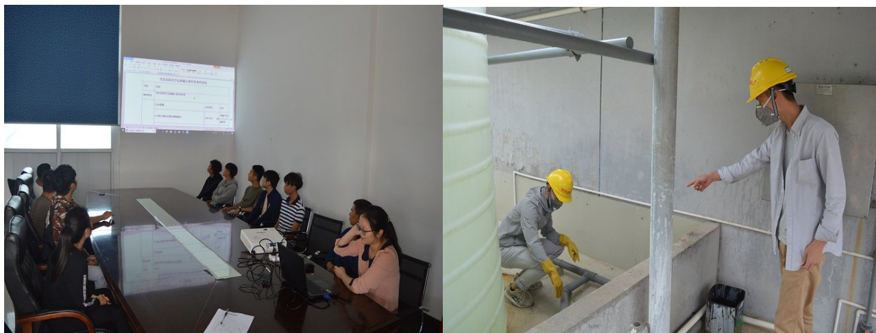
图 1. 组织开展环保应急预案演练

我公司制定的《突发环境事件应急预案》已通过了市环保部门组织的专家评审，并已报送市环保局备案。