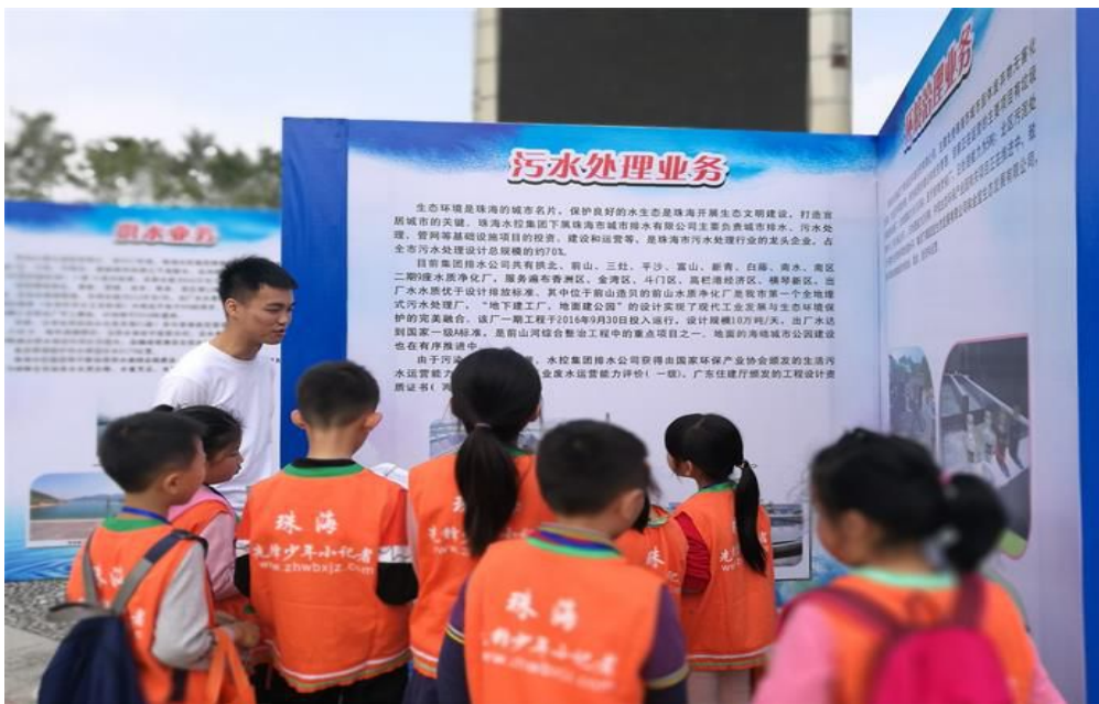
图 3. 积极参加“世界水日”“中国水周”宣传活动

公司环境信息及时向社会公众进行披露，积极参与当地公益活动，为地方经济发展贡献力量，并获得当地政府部门的表扬。